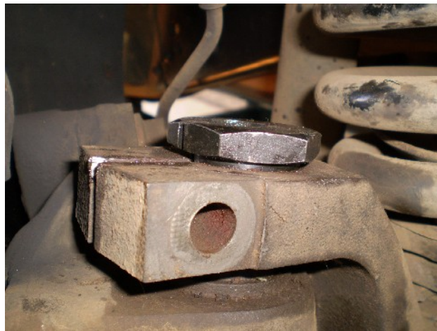
6 – Passo: Encaixar a bucha