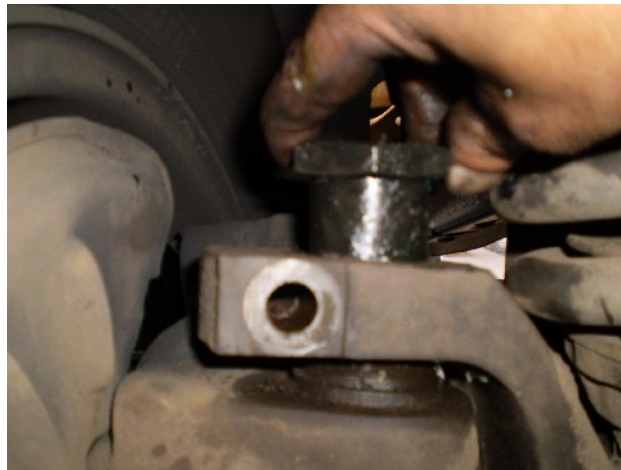
5 – Passo: Fixar a nova bucha no local a ser instalado