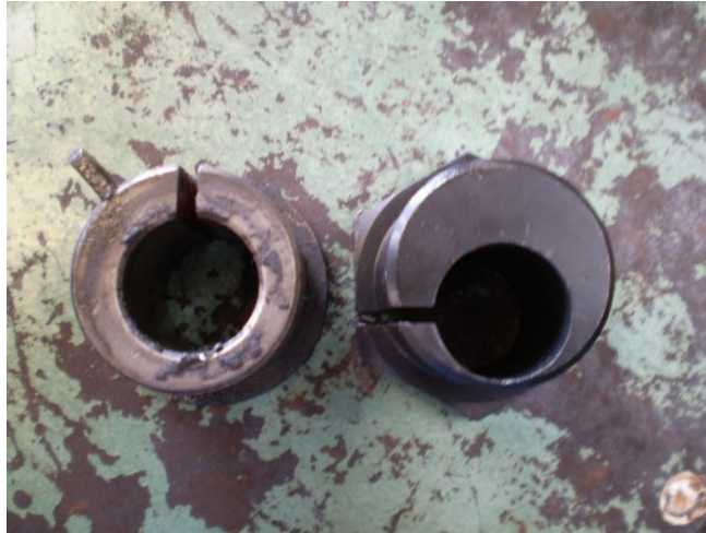
4 – Passo: Comparativo bucha velha e nova