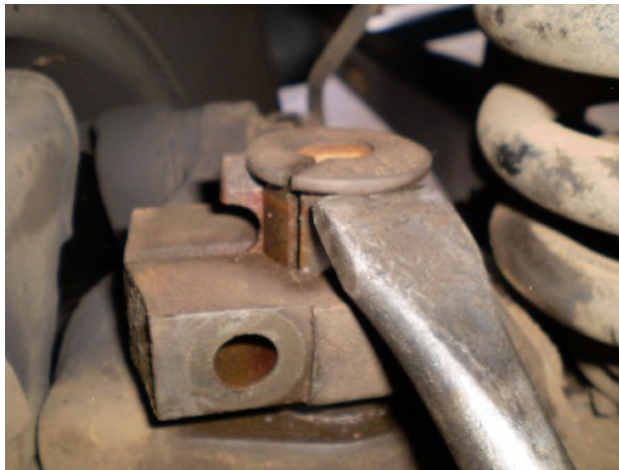
2 – Passo: Sacar a bucha antiga