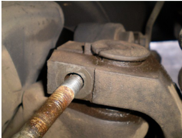
1 – Passo: Retirar o parafuso de fixação